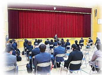
【PTA・ふじづる総会の様子】

今年度も、PTA・ふじづる会の役員・委員の皆様を中心に、会員の皆様と協力しながら、子どもたちのためによりよい教育を創り上げていきたいと考えております。新型コロナウイルス感染症拡大防止の観点から、来校の機会は限られておりますが、ご理解とご協力のほどよろしくお願いいたします。