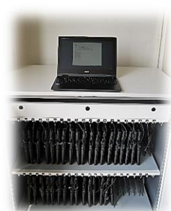
【各教室のラックとPC】